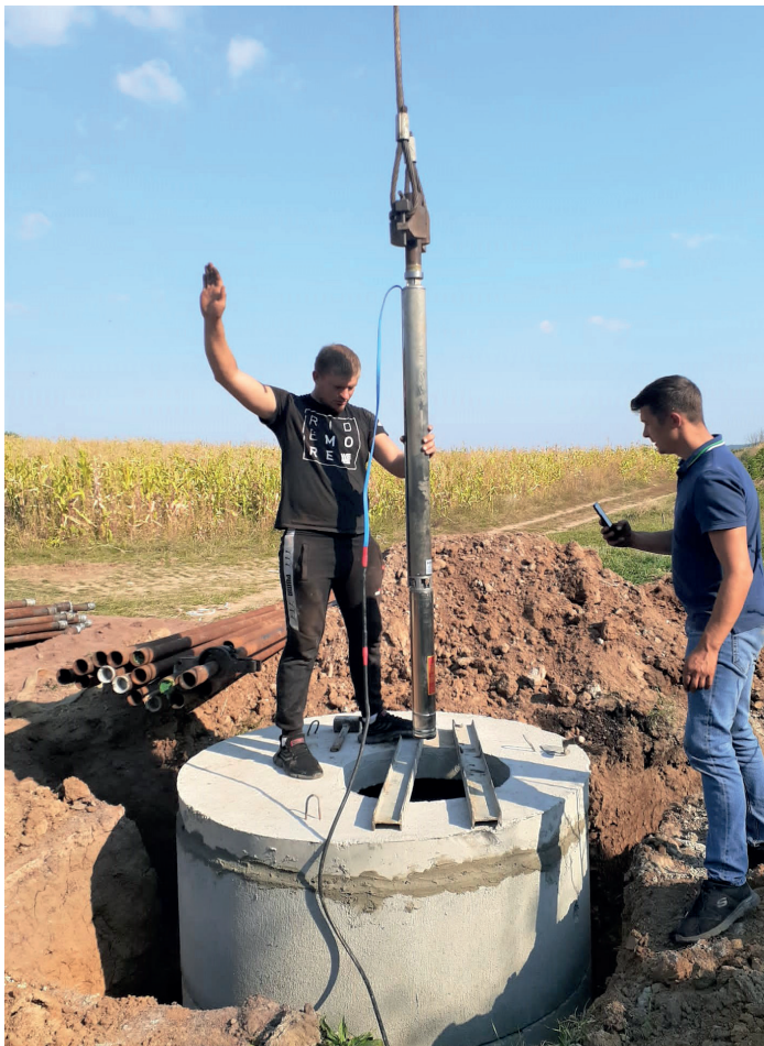
■ Die Wasserpumpe aus Italien ist eingetroffen. Sie wird mittels eines Kranwagens 230 Meter tief versenkt

H eute, da ich diese Zeilen schreibe, es ist der 3. Oktober, erreicht uns die Nachricht, dass das Projekt COBILEA erfolgreich beendet werden konnte. Wir freuen uns sehr, dass es durch die Hilfe unserer Spender gelang, erneut einer Ortschaft in Moldau wieder Trinkwasser bereitzustellen zu können.