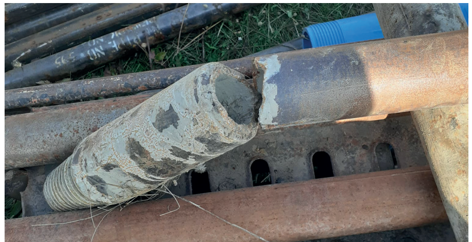
■ Der Bohrkopf ist zerbrochen