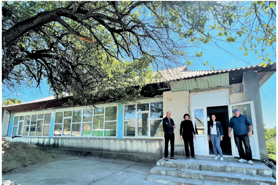
■ Dieses Gebäude ist für die geplante Suppenküche vorgesehen.

Initiativen dieser Art, wachsen nur auf dem Boden engagierter Personen, welche die ganze Last der Finanzierung und Durchführung auf den eigenen Schultern zu tragen haben. Bei unserem Besuch stellten wir fest, dass weitere Räumlichkeiten für die Kucheneinrichtung, Gerätschaften, Sanitärhygiene, Kanalisation und Nahrungsmitteldepot geschaffen werden müssen.