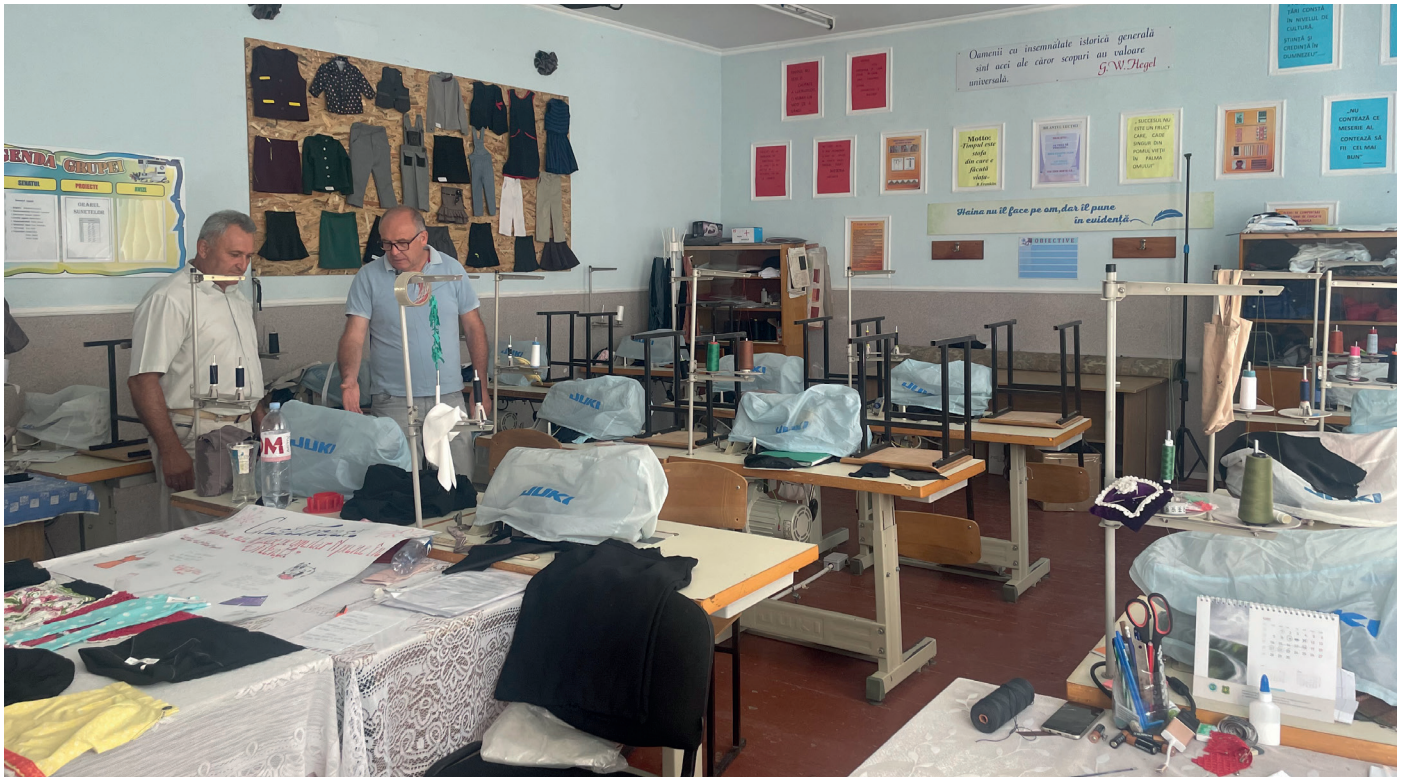
■ Besuch in einem kleinen Lehrraum, in dem zukünftige Schneider(innen) ausgebildet werden.