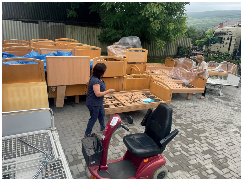
Aus Mangel an einer Depotmöglichkeit, wurden die Betten direkt vom Lastwagen auf den Hof des Sozialzentrums in Calarasi entladen, wo diese anschließend mit Plastikfolien abgedeckt wurden. Auch dieser Elektrorollstuhl ist eine dringend benötigte Sachspende.

ten in Haushalte abgegeben werde, womit sie eine unglaubliche Freude und Dankbarkeit erfahre. Es sei ihr ein großes Bedürfnis diese Dankbarkeit an uns weiterzuleiten und bat uns, wenn möglich, auch wei-