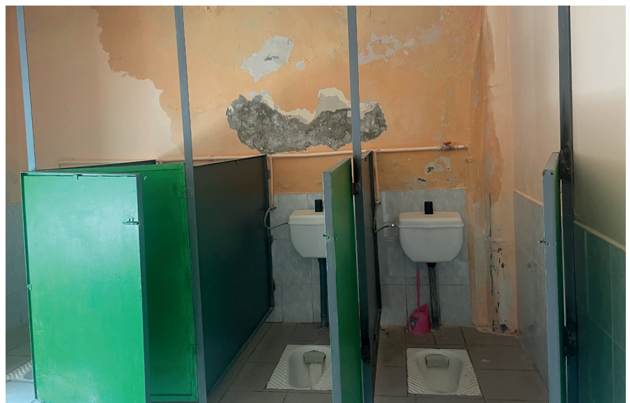
■ Eine nicht gerade zeitgemäße Toilette. Das könnte bestimmt auch in dieser Berufsschule ein Ansatzpunkt für Pro Humanitate sein.

Am Ende unseres Schulbesuchs hat uns der Schulleiter zu einer Stadtrundfahrt eingeladen. Nicht ohne Stolz führte er uns durch einen wunderschönen Park, der auch mit Beteiligung der Schüler unterhalten wird.