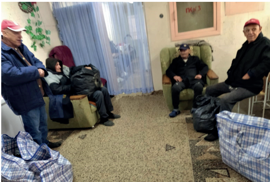
■ Die wohnsitzlosen Bedürftigen harren mit ihren wenigen Habseligkeiten der Dinge auf ihren „Koffern“.