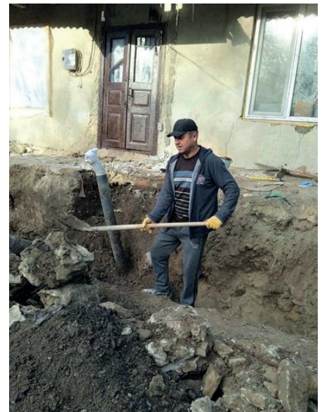
■ Nach der Entfernung der Hohlblocksteine, ist ein Arbeiter dabei das Fundament für einen Anbau auszuheben.

N ach überschlägigen Berechnungen sollte die gespendete Summe ausreichen, um die erforderlichen Baumaßnahmen zu dieser beabsichtigten Stabilisierung decken zu können. Die Großmutter dieser Familie berichtete, dass