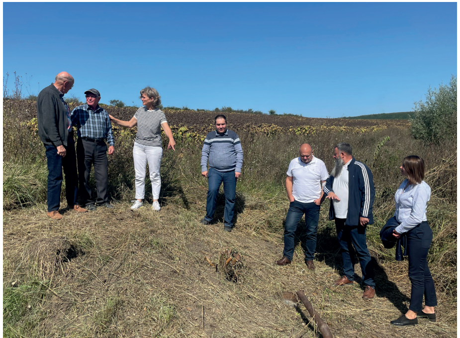
■ Wir nehmen das geplante Anwesen in Augenschein. Es ist, nach Renovation, für eine Sozialstation geeignet.

I n einem sehr offenen Gespräch mit dem Bürgermeister erklärten wir, dass unsererseits allenfalls ein finanzieller Beitrag zu diesem Projekt in Höhe von 25 – bis max. 30 000 Euro möglich wäre, wobei wir, wie schon bei unseren anderen Wasserprojekten einen Bauvertrag über unseren Beitrag ausschließlich in deutscher Sprache und nach den bisherigen Gepflo-