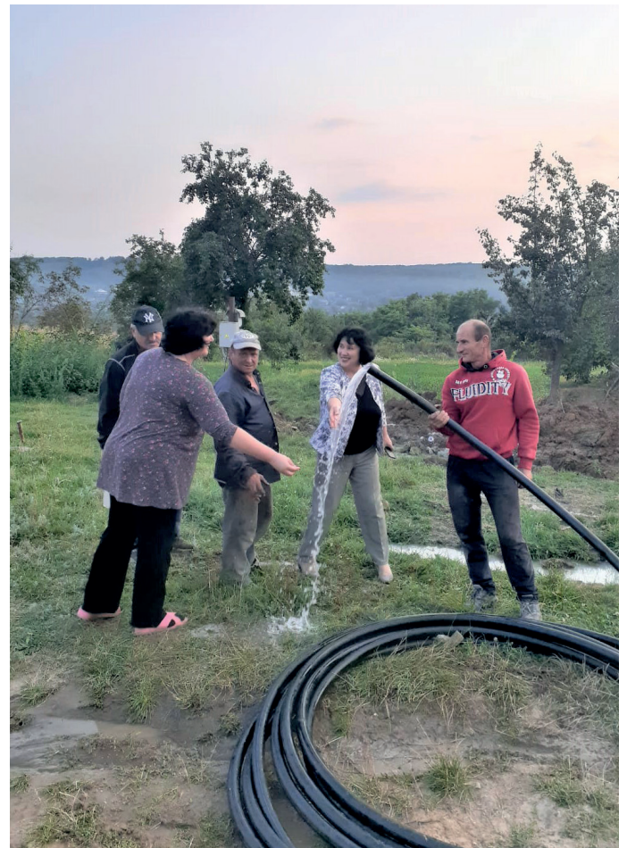
■ Endlich, das Wasser in Cobilea fließt