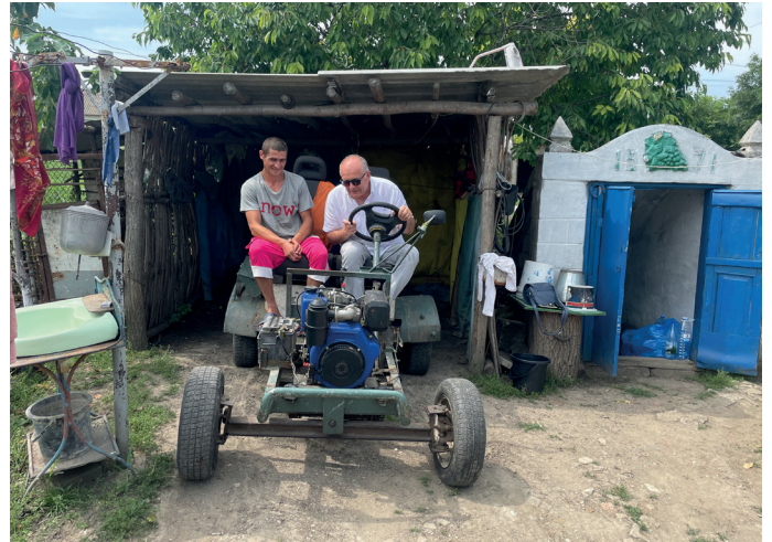
■ Das vom Hausherrn selbst gebastelte Gefährt. Eine kurze technische Einweisung und es geht los.