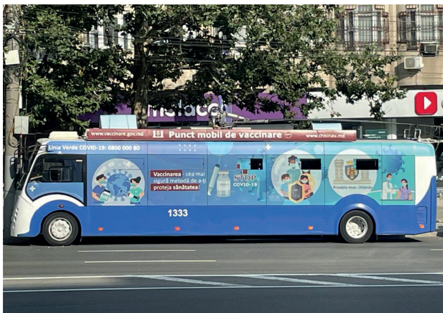
Der Covid – Impfbus in Chisinau

bus, bei dem sich die Bevölkerung sich impfen lassen kann.