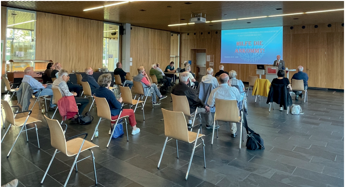
■ Endlich konnte nach 2 Jahren Zwangspause durch Corona, wieder eine Jahresversammlung stattfinden

gelung gehalten und waren froh, dass alle Teilnehmer die erbetene Bescheinigung übersandt hatten.