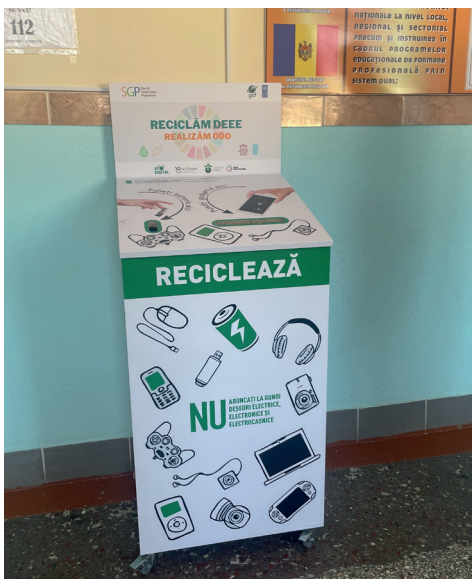
■ Bei einem Wettbewerb konnten die Schüler für die Entwicklung dieser Recyclingbox für Elektronikschrott, einen Preis ergattern.