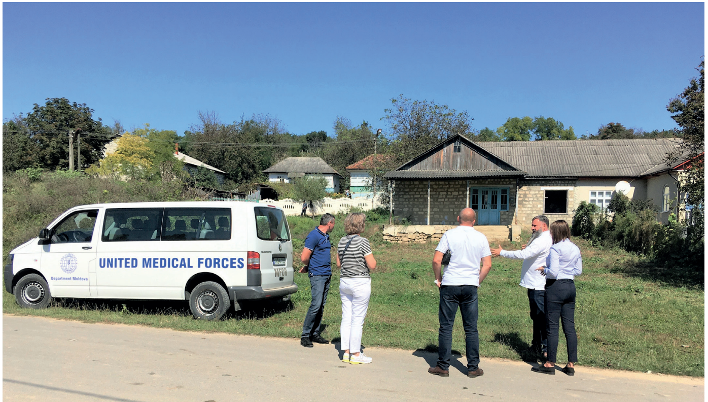
■ Wir nehmen das geplante Anwesen in Augenschein. Es ist, nach Renovation, für eine Sozialstation geeignet.

ser Vorhaben geeignet ist. Hierbei sind jedoch mehrere bauliche Arbeiten zu erledigen.