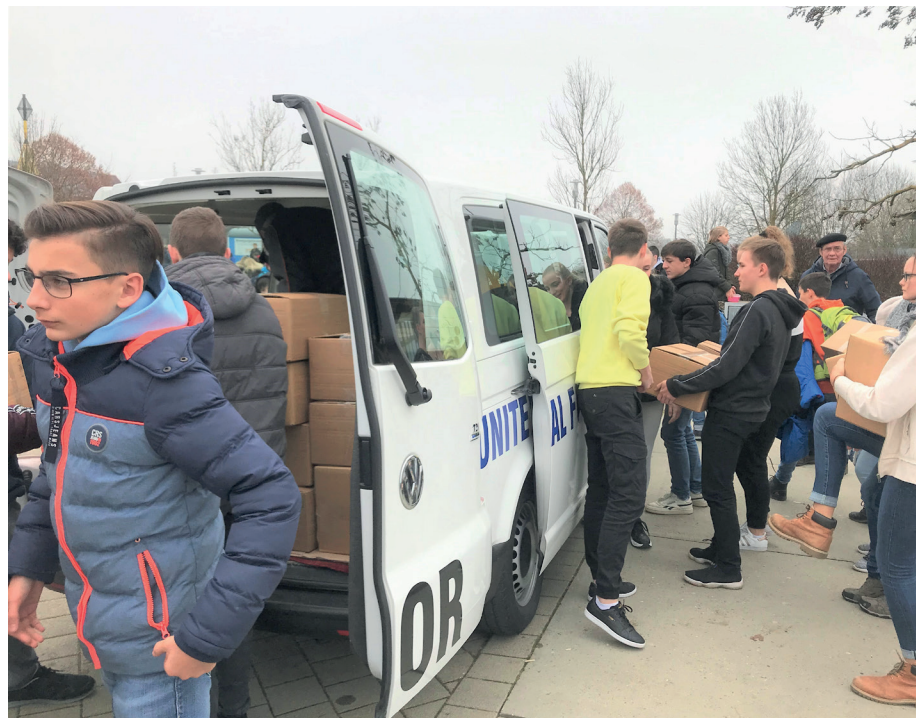
■ Bild der letztjährigen MFOR- Lebensmittelaktion des Engener Gmnasiums. Unser VW-Bus wird mit den Hilfspaketen beladen, welche ins Depot gebracht werden, um danach mit dem LKW die Reise nach Moldau anzutreten.