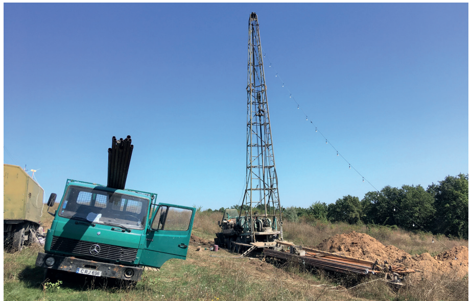
■ Anlieferung des Bohrgestänges an der Baustelle