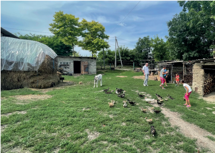
■ Familie Chirtoacas Naturhof