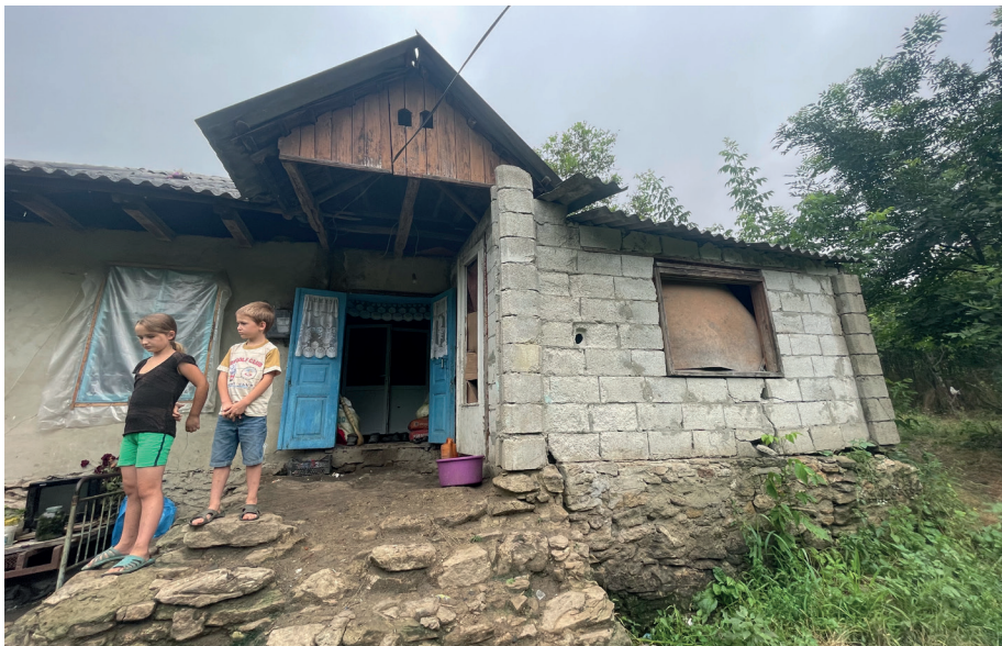
■ Das Anwesen der Familie Hasnas vor Beginn der Renovation. Die früher verbauten Hohlblocksteine müssen entfernt werden.

einfach nicht für ein alternatives aufgelassenes Anwesen ausreichend ist, der Winter jedoch bevorsteht, haben wir uns, nachdem sich keine Alternative bot, mit einer Stabilisierung des Anwesens der Familie Hasnas beschäftigt.