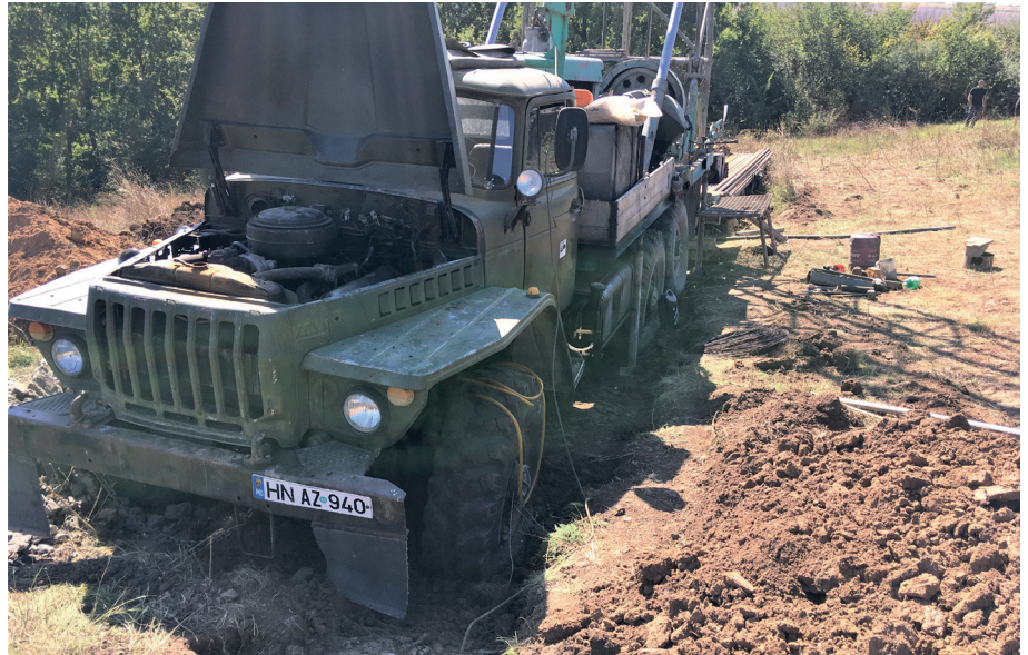
■ Das „Bohrgerät in COBILEA. Ich bin immer wieder erstaunt, dass diese Technik funktioniert.