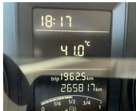
■ Gerade 41° C zeigt unser Bordthermometer

D er Juli ist von extrem hohen Temperaturen geprägt, daher ist unser Fahrzeug mit integrierter Klimaanlage ein Segen.