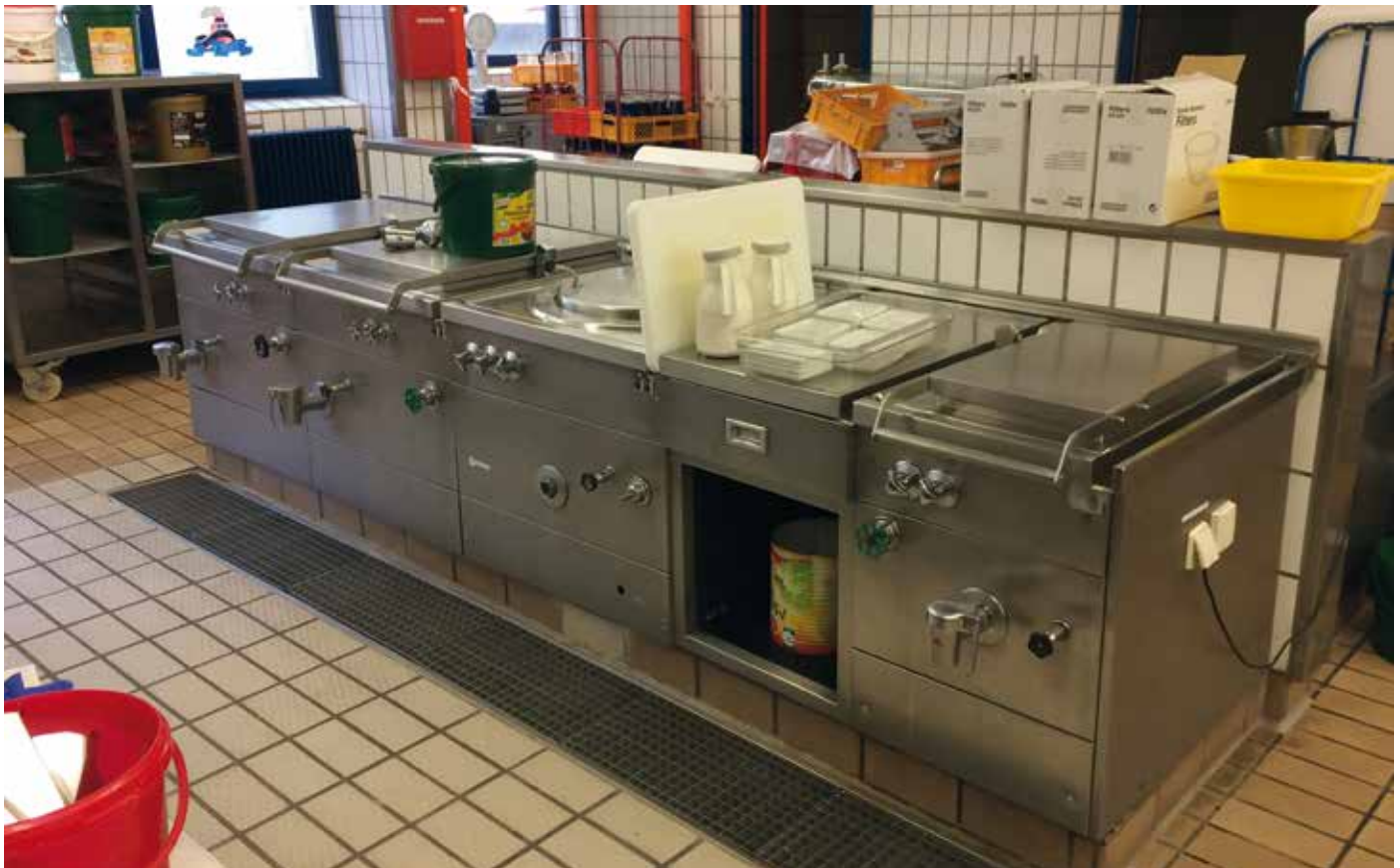
■ Eine der vielen Küchenzeilen des Vincentius Klinikums vor der Demontage.