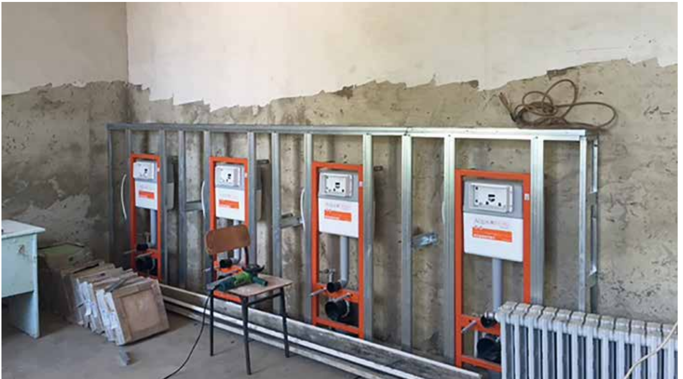
■ Fortschritt der Bauarbeiten. Es werden moderne Spülkästen installiert.