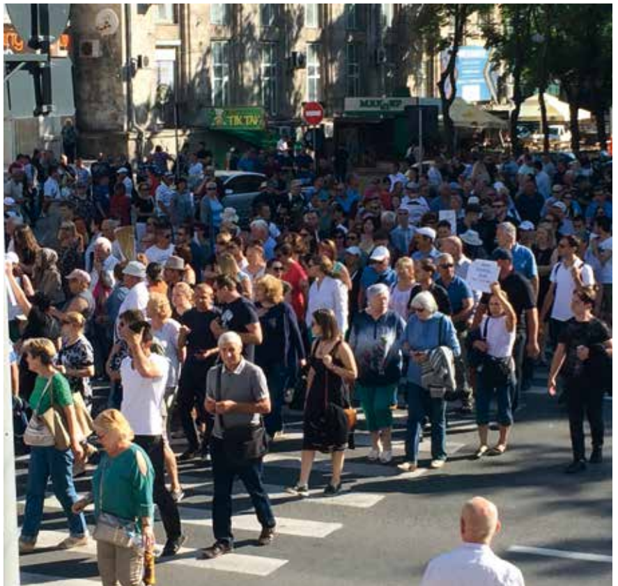
■ Demonstrationen anlässlich der durch Oligarchen vereitelten Bürgermeisterwahl in Chisinau.