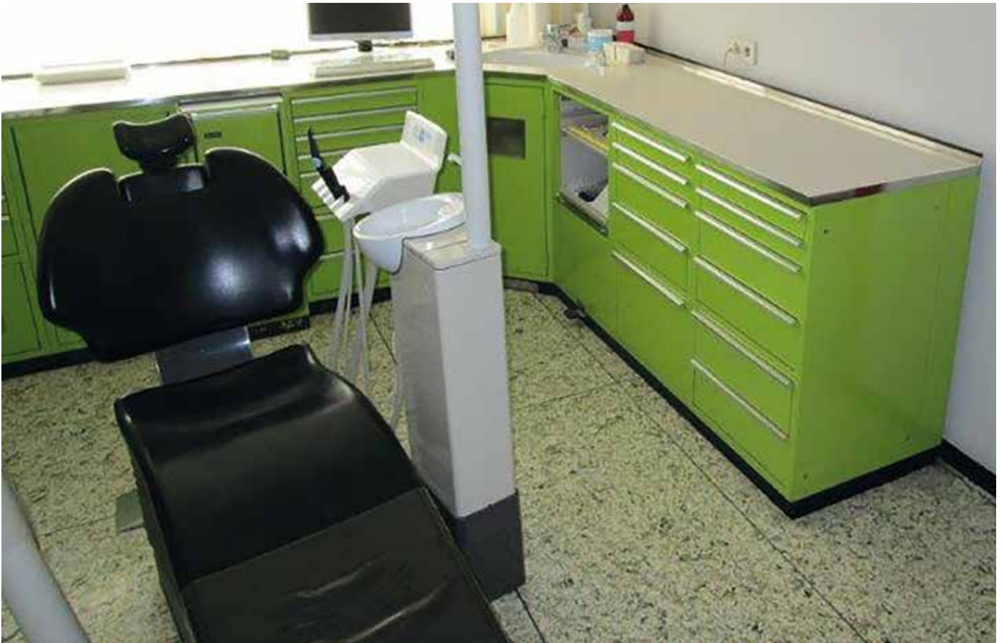
■ Die beiden Behandlungszimmer der Singener Zahnarztpraxis vor dem Ausbau.