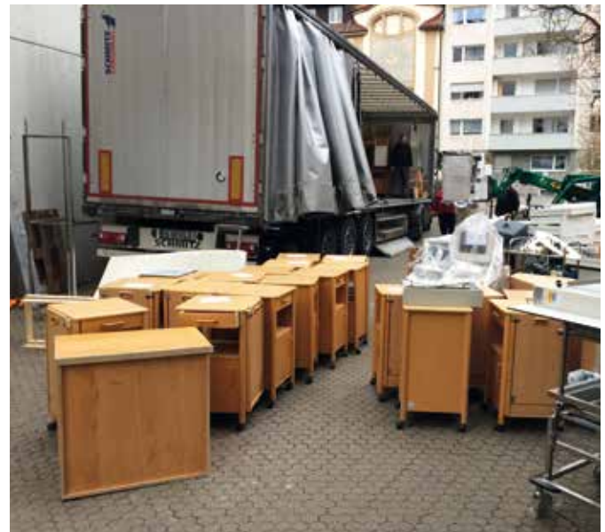
■ Die Bilder zeigen Teile der ausgebauten Materialien bei der Verladung in die LKW's