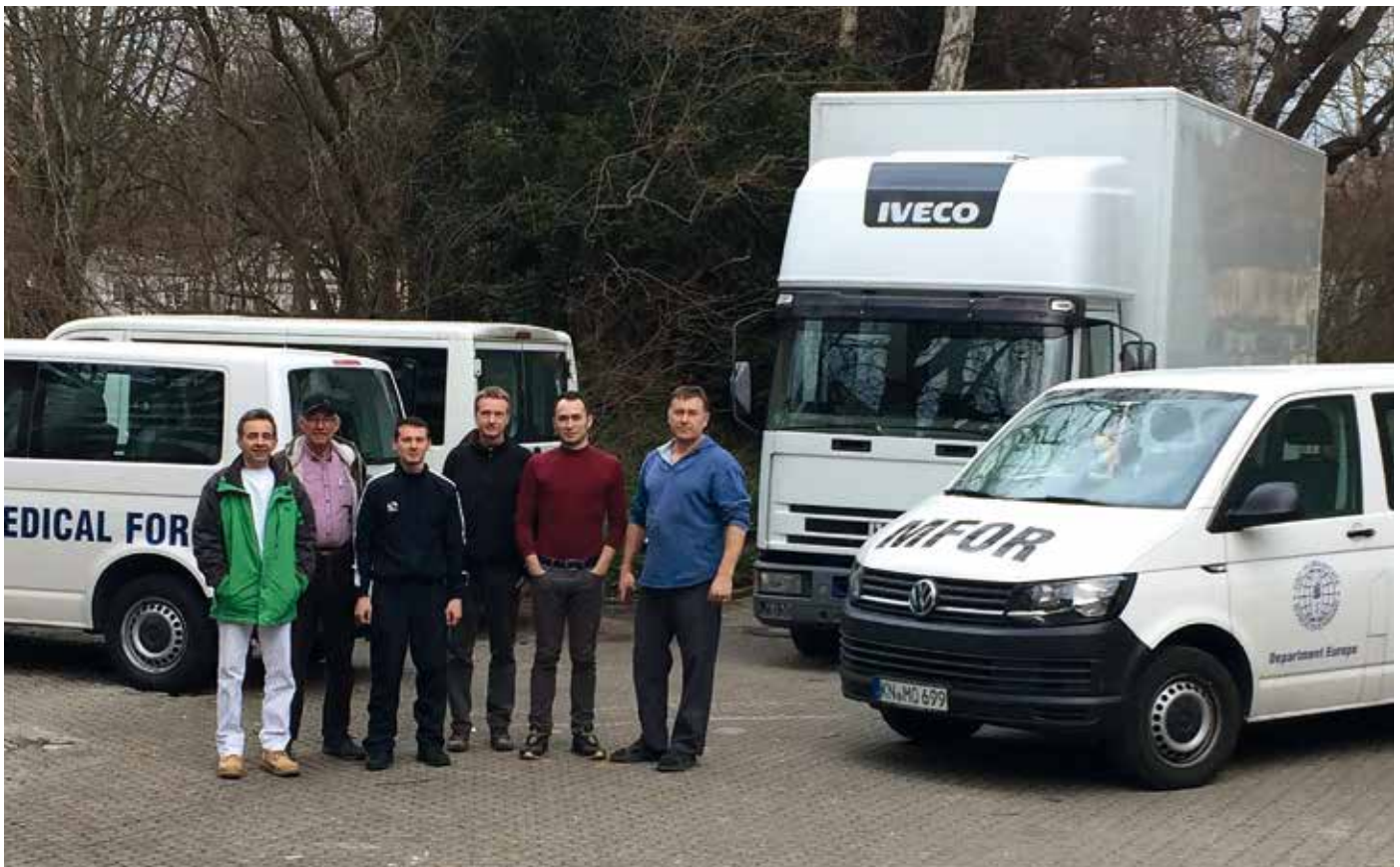
■ Die Ausbau- und Verlademannschaft nach Beendigung der Arbeiten