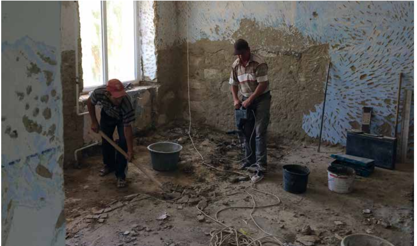
■ Erste Bauarbeiten in der Schule Mingir zur Installation moderner Toilettenanlagen.