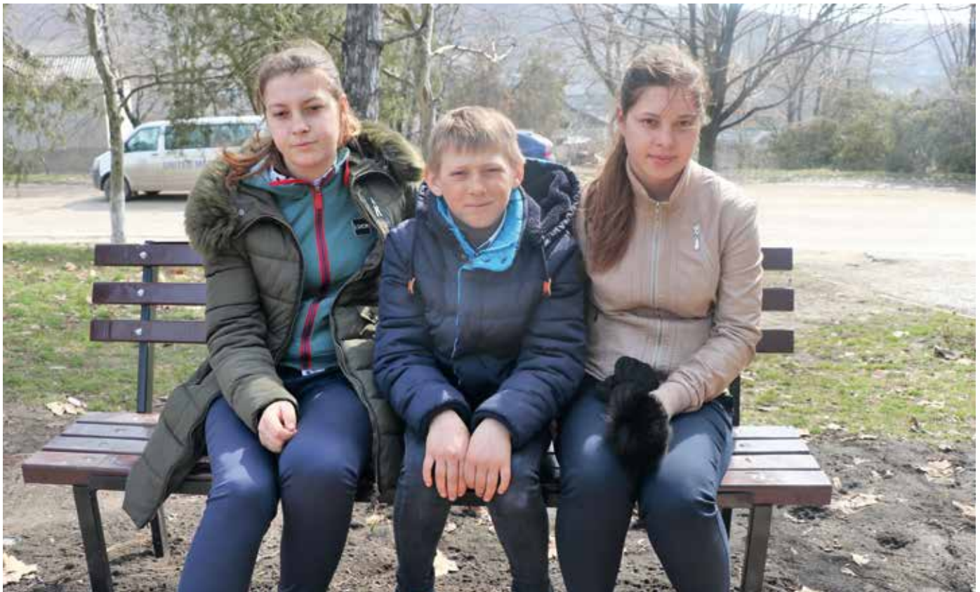
■ Die verzweifelten Kinder der Familie Groza.