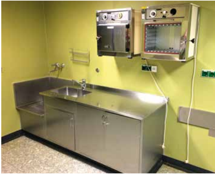
■ Materialien aus dem OP- und Pflegebereich.