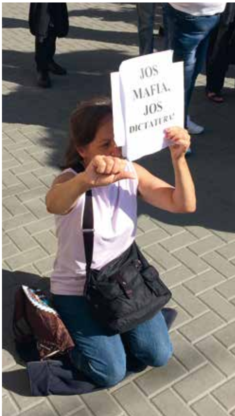
■ Nieder mit der Mafia, nieder mit der Diktatur.

Es scheint, als ob der in Moldau bekannte Oligarch das Maß überzogen hat, denn auch das Ausland wird aufmerksamer. Es wäre wünschenswert, wenn Moldau sich Rumänien anschließen würde.