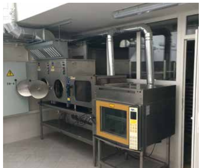
■ Die Bilder zeigen die in den Kliniken Rottweil und Konstanz ausgebauten Klinikkücheneinrichtungen sowie gespendete Geräte der Fa. Hilbinox aus Engen.