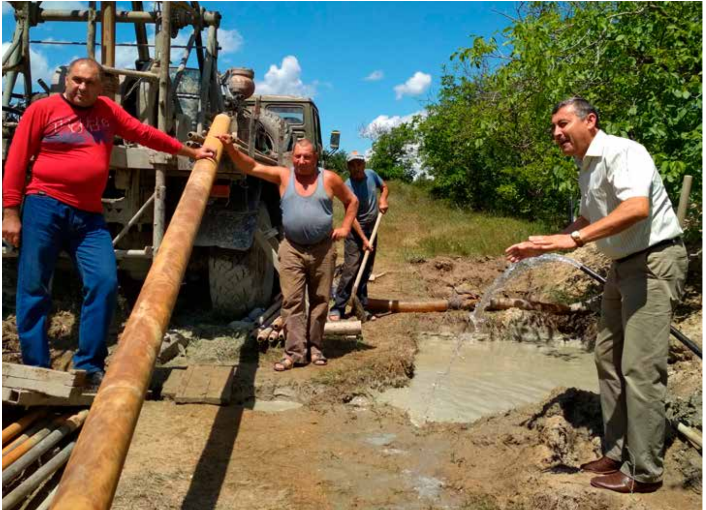
■ Der Bürgermeister „begrüßt“ den ersten Wasserstrahl mit einem Freudenschrei.

E in solches Ereignis ist immer ein Anlass dafür, dass die gesamte Bevölkerung an der Einweihung der Wasserversorgung teilnimmt. Über die Einweihung werden wir zu späterer Zeit in einer Folgeausgabe unserer Verbandsnachrichten berichten.