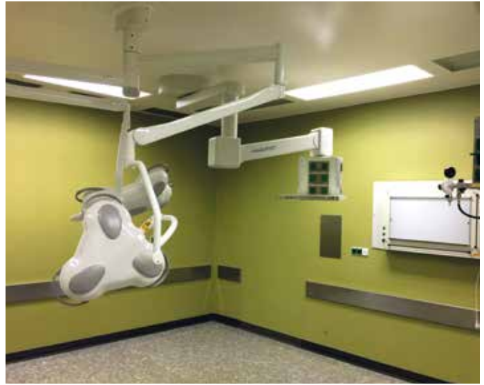
■ Lampen und Röntgenbildbetrachter aus dem OP-Bereich.