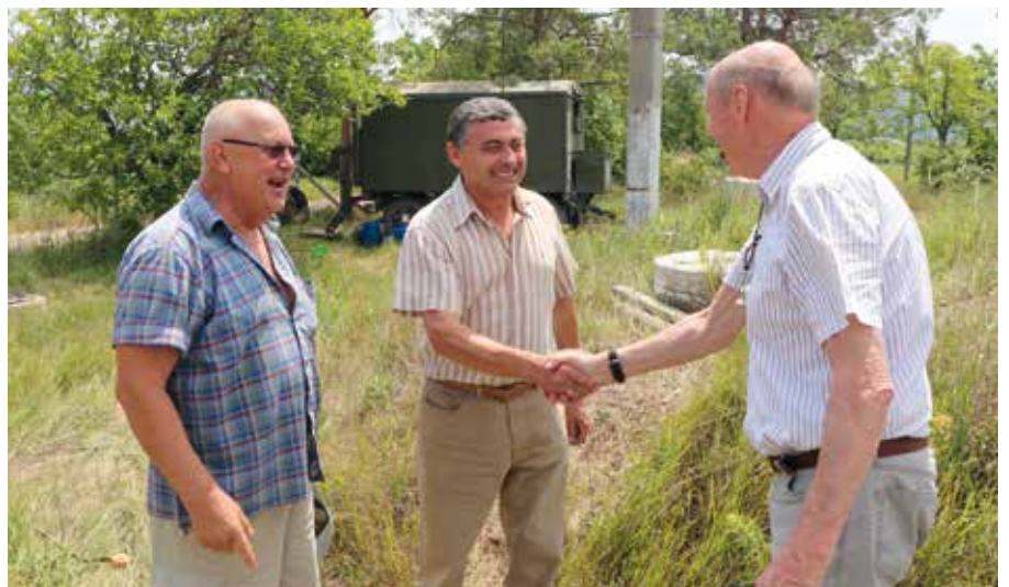
■ Per Handschlag verabschieden wir uns vom Bürgermeister und dem Wasserbauingenieur.