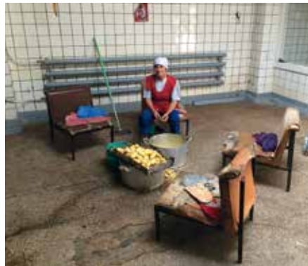
■ Die „Kartoffelschälerin“ bei ihrer Arbeit im Jahre 2016

A ls wir in den Küchentrakt kommen, erkennt uns die ehemalige „Kartoffelschälerin“ (in einer früheren Ausgabe unserer Verbandsnachrichten zeigten wir ein Bild von ihr) und kommt mit ausgebreiteten Armen freudestrahlend auf uns zu. Sie umarmt uns, wobei sie in gebrochenem Deutsch sagt: „Danke, Danke, sie haben uns ein Stück Deutschland geschenkt. Nie hätte ich gedacht, dass ich jemals in einem solchen Arbeitsverhältnis arbeiten würde!“