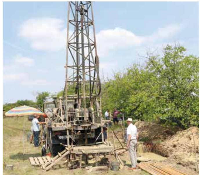
Anlässlich unseres Besuches in der Ortschaft Negrea waren die Bohrarbeiten bereits voll im Gange.