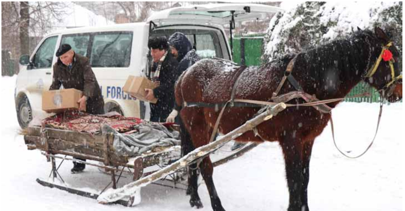
■ Wir laden die MFOR-Pakete zum Weitertransport auf den Pferdeschlitten um.