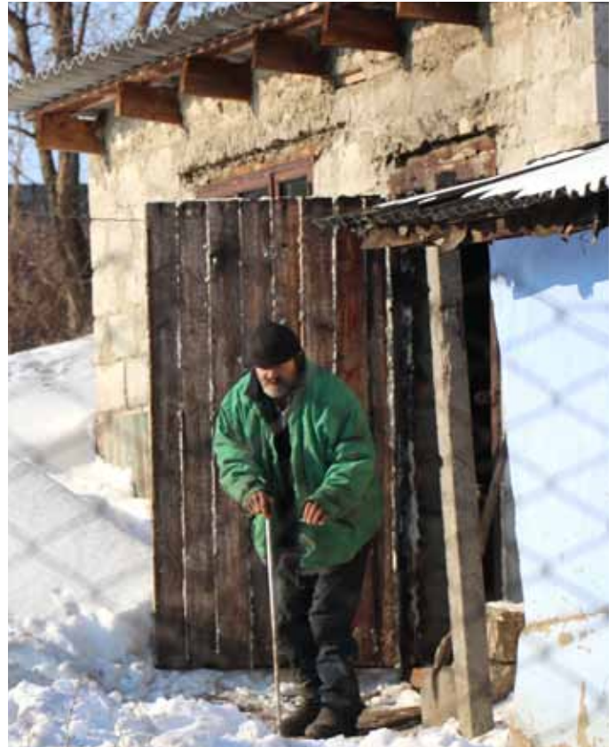
■ Beim Verlassen seiner Unterkunft schaut er uns nach. Noch hat er nicht begriffen wie ihm geschah.