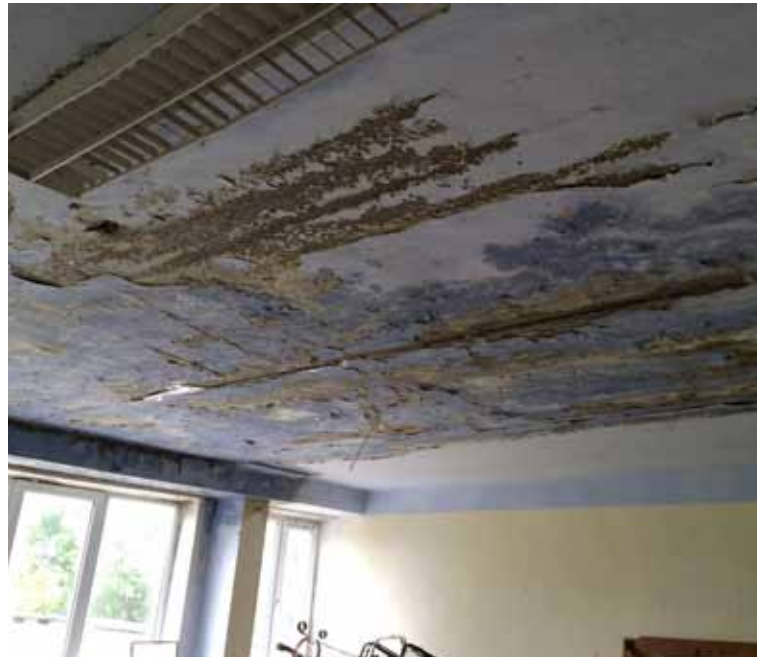
■ Altzustand des Kindergartens in Leova. Durch die Decke dringt das Wasser, das Gebäude ist vollständig durchnässt.