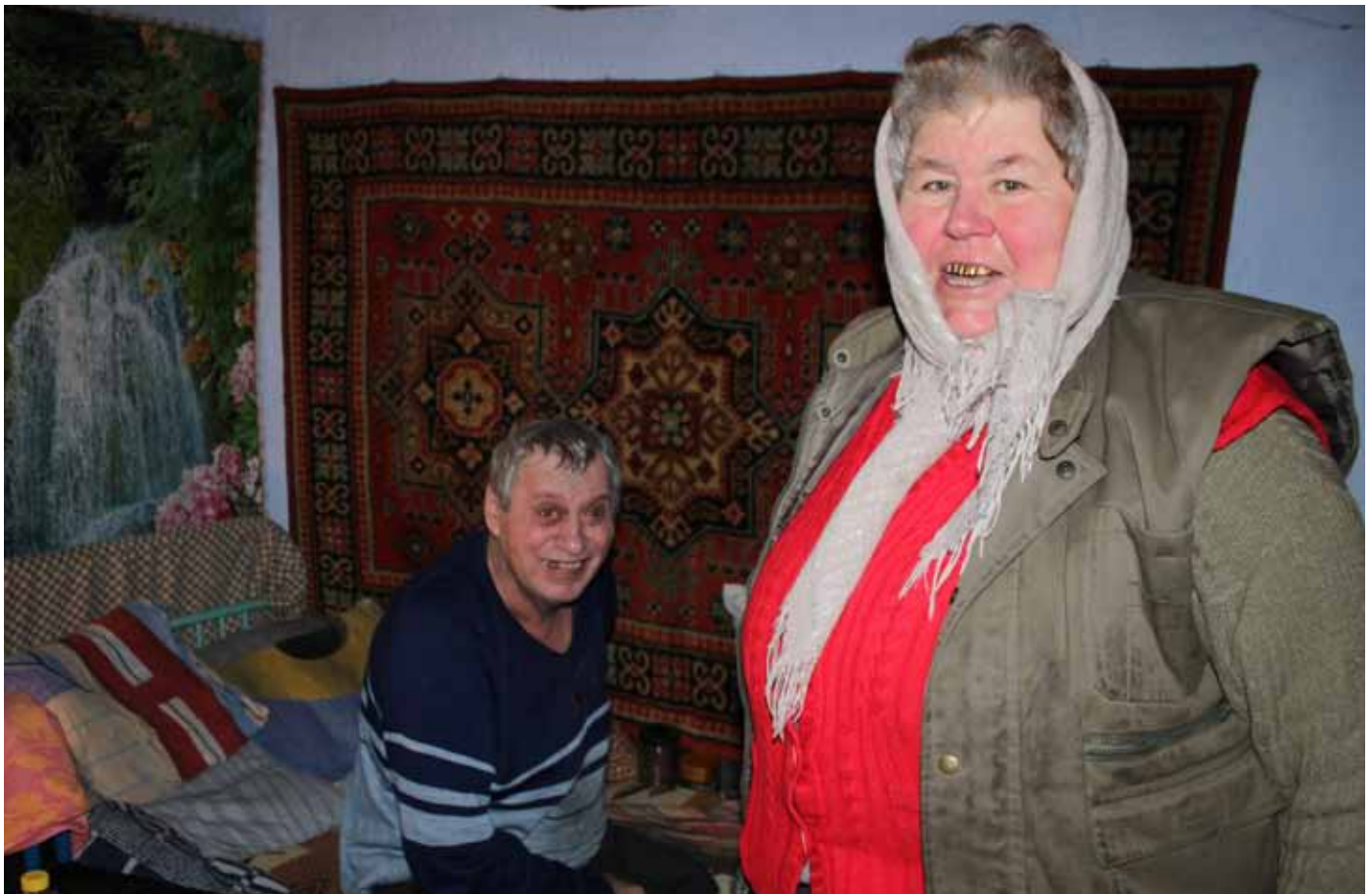
■ Das Weihnachtslied hat die Spannung gelöst. Frieden war spürbar.