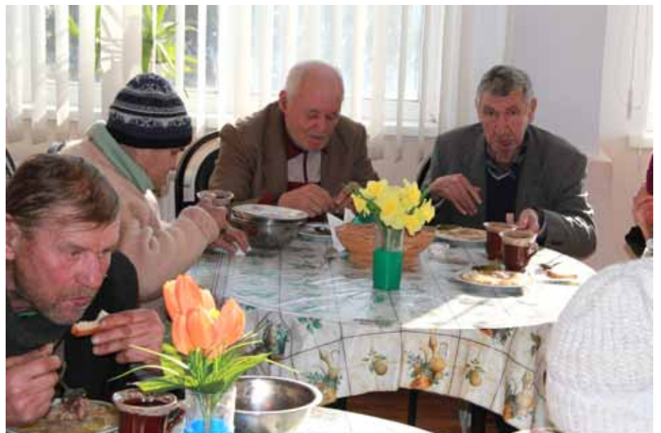
■ Bedürftige in Leova nehmen in unserer Suppenküche das Essen zu sich. Die Tische sind nett mit Kunstblumen geschmückt.

einander kommunizieren. Sehr oft trägt das private Engagement der Sozialhelferinnen ganz wesentlich zur Verbesserung der sozialen Situation bei.