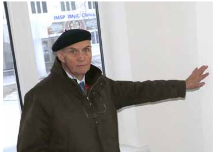
■ Mit Putzen der Firma STOTMEISTER werden hier eine Kliniketage und Treppenaufgänge saniert.