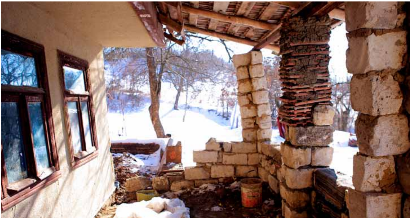
■ Außenansicht der „Villa Antir“ in Codreanca