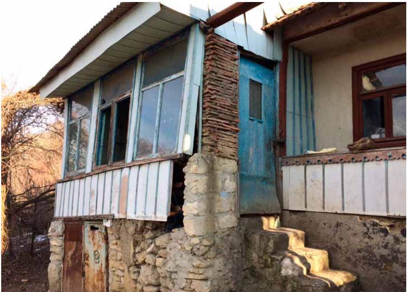
■ Das Haus bricht zusammen. Wegen der Hanglage besteht Lebensgefahr.