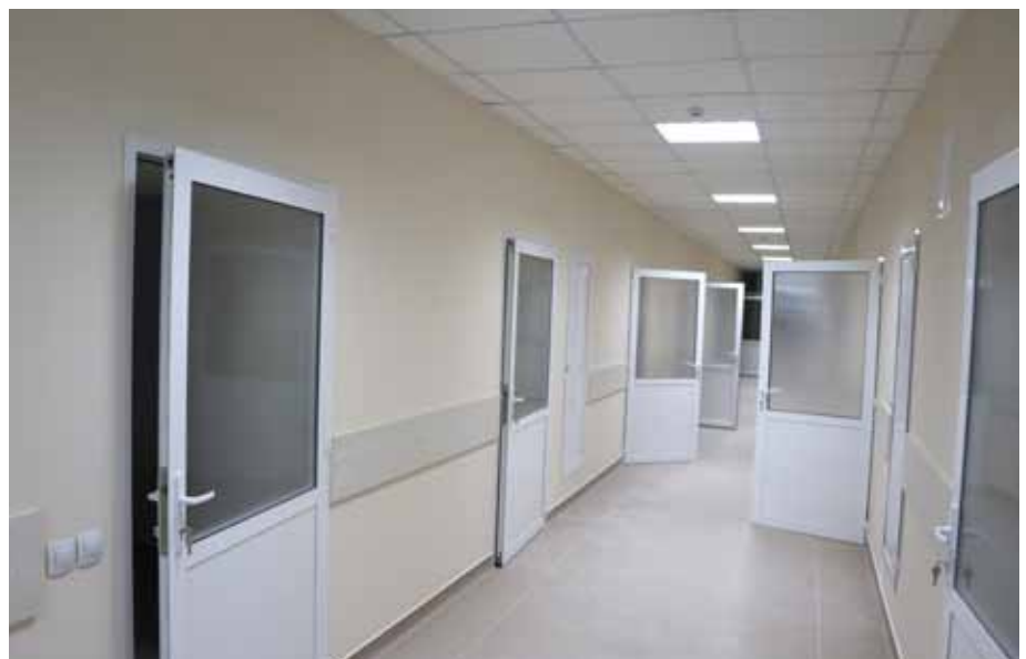
■ Eine fertig sanierte Etage der Klinik Mutter und Kind.