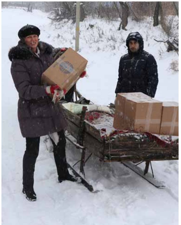
■ Gemeinsam sind wir dabei den Pferdeschlitten zu entladen und verbringen die MFOR-Pakete zu den Bedürftigen.

Fortsetzung siehe Seite 14