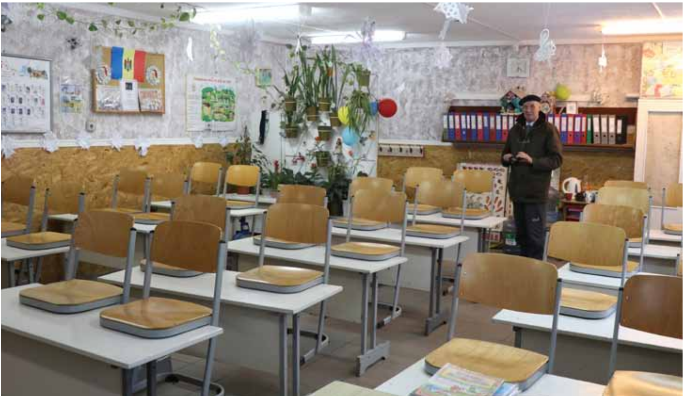
■ Das von uns gelieferte, gebrauchte und sauber aufgearbeitete Schulmobiliar macht einen gepflegten Eindruck.