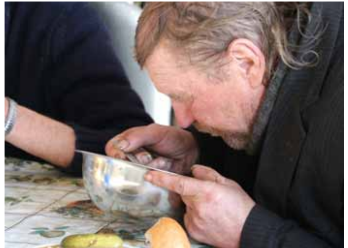
■ Dankbar nehmen die Menschen, in sauberen geheizten Räumen, ihre Nahrung ein.